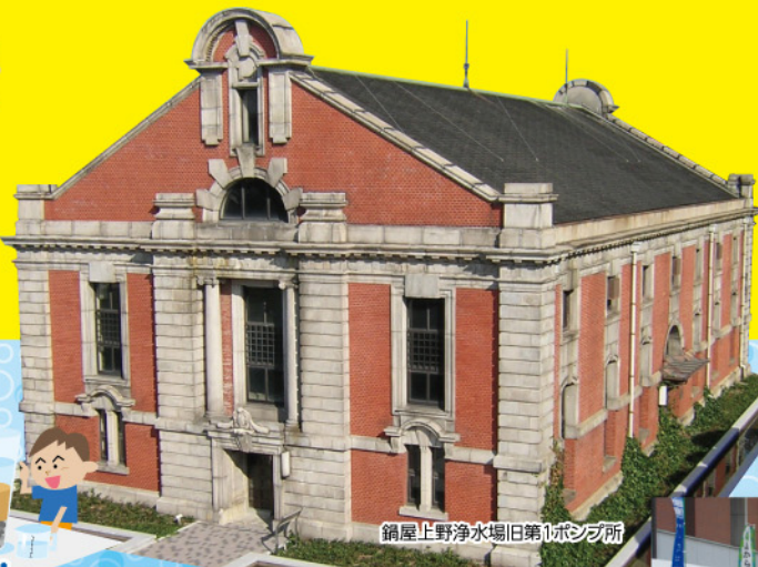
鍋屋上野浄水場旧第1ポンプ所