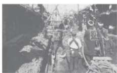
創設期の配水管布設工事