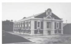
旧第1ポンプ所(鍋屋上野浄水場)