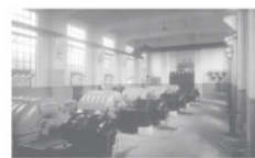
日本初の活性汚泥処理に使用した直結プロフ(堀留水処理センター)