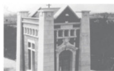
旧計量室(東山配水場)