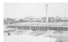
創設時の堀留下水処理場(現在の堀留水処理センター)