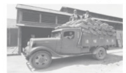
「名古屋産活性汚泥肥料」販売のための運搬作業